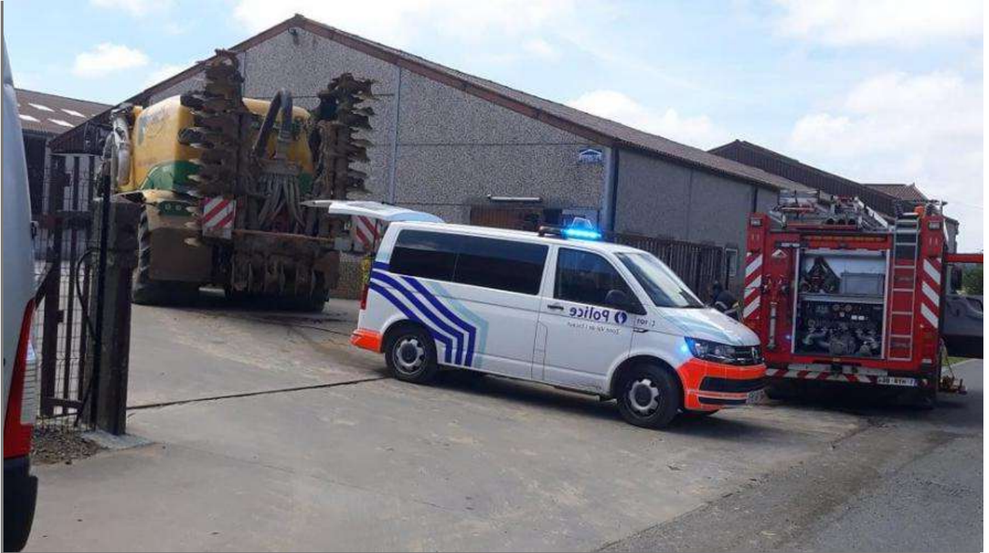
La ferme de l'Officier à la rue du Hêtre à Escanaffles. - B.L.

Deux ouvriers, un homme et une femme, qui travaillaient ont respiré des gaz toxiques en descendant dans la fosse.